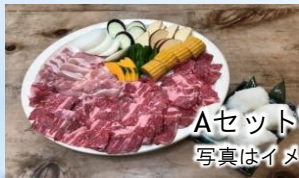
Aセット ¥2,160 写真はイメージです