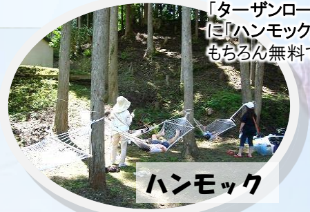
「ターザンロープ」に「ハンモック」もちろん無料です。