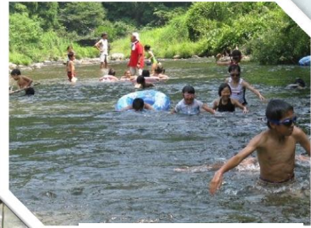
やっぱり川遊びでしょ!